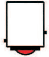
BAY 15 d

Bei LED-Lampen mit Abstrahlrichtung " V " müssen die LEDs waagrecht zur Fahrbahn stehen, um die optimale Ausleuchtung zu garantieren!