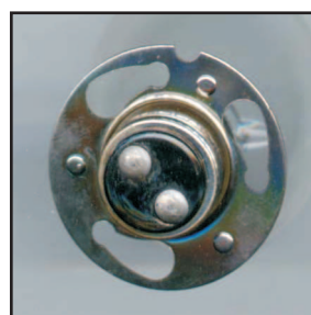
Socket - Ø: 15mm Scheiben - Ø: 30mm