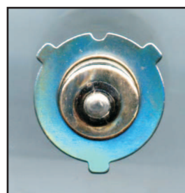
Socket - Ø: 15mm Scheiben - Ø: 25mm