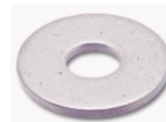
DIN 9021 - A2