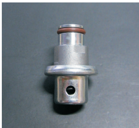
V-36771 Druckregler 010 3,0 Bar