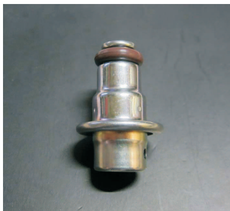
V-33162 Druckregler 005 3,0 Bar