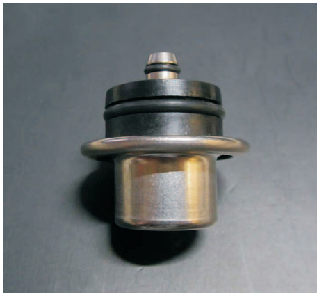
V-33172 Druckregler 007 3,5 Bar