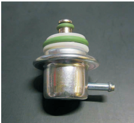
V-33177 Druckregler 008 3,0 Bar