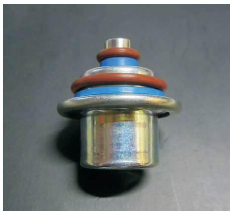
V-33165 Druckregler 006 3,5 Bar