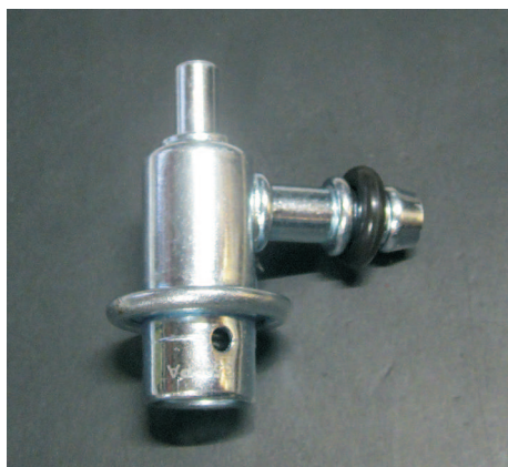
V-35276 Druckregler 009 3,5 Bar