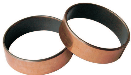
Gleitbuchsen TA Beschichtung innen