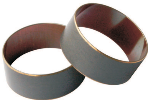
Gleitbuchsen ST Beschichtung aussen